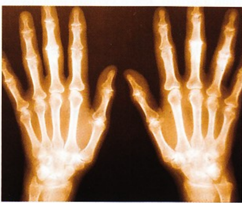
» Závažnou komplikací lupénky je bolestivá psoriatická artritida

Dávky však byly příliš vysoké, takže působi- ly toxicky. Lékaři se snaží částečně nemoc potlačit různými léky, které občas mají ved- lejší negativní účinky. Jiní postižení hledají spásu ve slunění, lidé s méně viditelným po- stížením využívají rovněž koupele v Mrtvém moři.