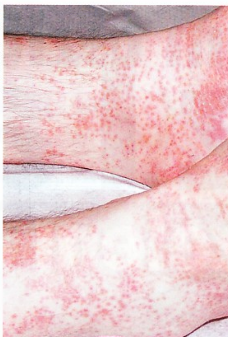
» Lupénka je chronická zánětlivá kožní choroba. Vzniká na základě dědičného sklonu k odchylkám imunitního systému a kůže.

pus Hippocraticum, vydaném 100 let po smrti řeckého lékaře a filozofa Hippokrata (460–377 př. n. l.). Avšak teprve brněnský rodák, prof. Ferdinand von Hebra, v roce 1842 ve Vídni přesně definoval lupénku a popsal její různé klinické formy.