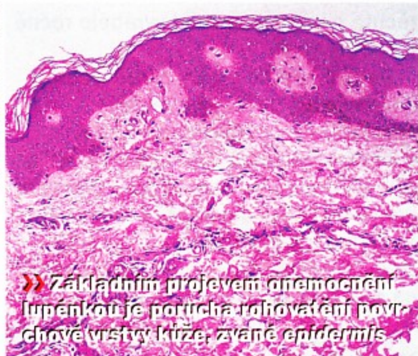
» Základním projevem onemocnění lupénkou je porucha rohovatění povrchové vrstvy kůže, zvané epidermis.

Umíte si představit, že na různých místech těla budete mít nevábně vyhlížející suché šupiny? Stěží se asi půjdete slunit na koupaliště, budete nosit krátké kalhoty či sukně. S podobnými problémy u nás musí žít přes 300 000 obětí lupénky – mužů, žen i dětí. A stále jich přibývá. Bohužel, zatím se nedá zcela vyléčit! Nyní tu však je velká naděje.